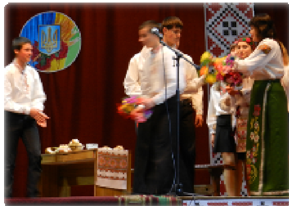
( Обрядові дійства Круглоозерський СБК)

Слід зазначити, що більшість фольклорних колективів дотримуються основних канонів фольклорного мистецтва, звертаючись у своїй творчості до місцевого пісенно-музичного матеріалу, елементів костюму, побуту, й що не менш важливо долучають до своєї творчості підростаюче покоління, таким чином в кожному обрядовому дійстві були задіяні, а подекуди й переважали у кількості учасників саме діти та молодь.