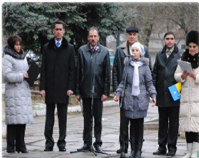
( літературний монтаж до Дня визволення м. Гола Пристань читають учасники гуртка художнього читання « Пролісок» Голопристанського РБК)

У співробітництві з відділом освіти районної державної адміністрації, центром соціальних служб для сім'ї, дітей та молоді, а також з іншими установами, організуються та проводяться вже традиційні районні фестивалі, фестивалі дитячої творчості, конкурси, огляди шкільної самодіяльності, творчі вечори місцевих діячів культури такі як наприклад: