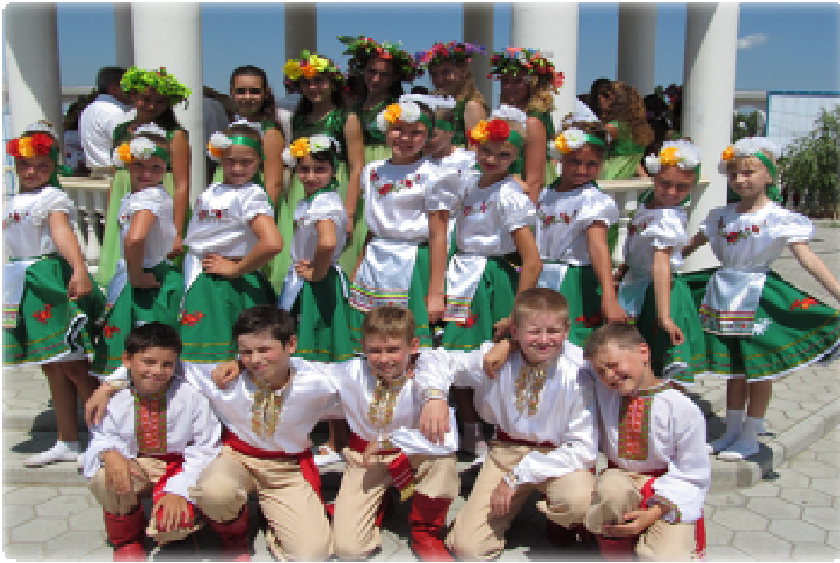
- Фестиваль « Український кавун – солодке диво» ( м. Гола Пристань);